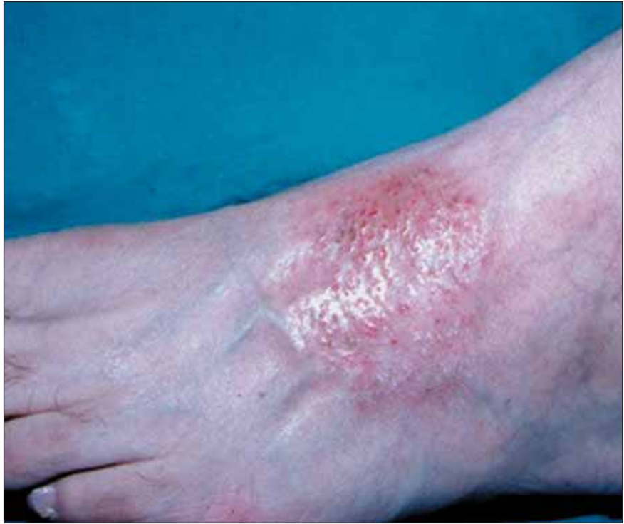
Figura 1. Eczema numular en dorso de pié.