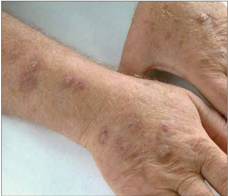
Figura 2. Eczema numular con múltiples lesiones, algunas liquenificadas, en antebrazos y dorso de manos.

hay que recurrir al estudio histopatológico y al estudio micológico. La tiña corporal puede requerir el examen directo y el cultivo de las escamas. La dermatitis de contacto mediante una buena historia clínica. La histología nos sirve para diferenciar del psoriasis y la micosis fungoide. También hay que